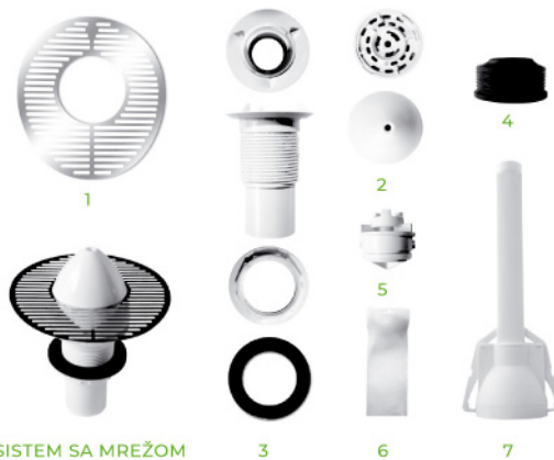
SISTEM SA MREŽOM